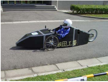
ゼッケン： 1 チーム名：飯田工業高等学校原動機部 記録：リタイア 表彰：フェアプレー賞（実行委員会賞）