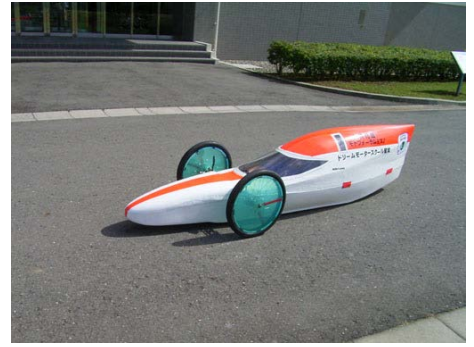
ゼッケン： 3 チーム名：LAURIER（篠ノ井西中学校） 記録：176.49 km/l