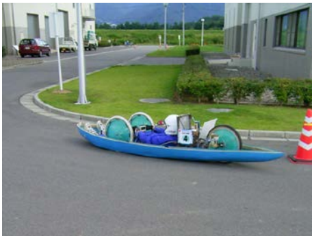
ゼッケン： 4 チーム名：Creation（篠ノ井西中学校） 記録：352.98 km/l 表彰：敢闘賞（競技委員長賞）