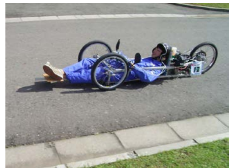
ゼッケン： 12 チーム名：長野工業機械科 Team Mot's 記録：348.41 km/l 表彰：技術賞（長野市長賞）