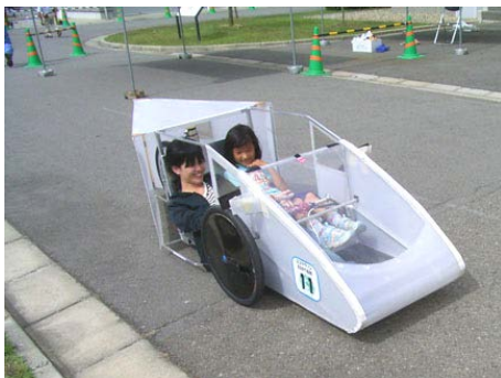
ゼッケン： 11 チーム名：長野高専エコノパワー部B 記録：134.38 km/l 表彰：デザイン賞（SBC信越放送賞）