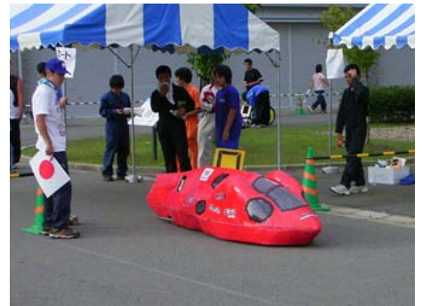
ゼッケン： 6 チーム名：Spirit（篠ノ井西中学校） 記録：363.47 km/l 表彰：燃費最優秀賞 （国土交通省长野国道事務所賞）