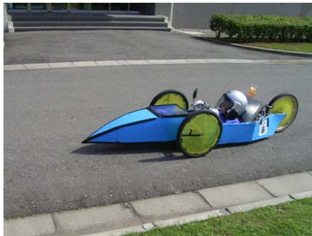
ゼッケン： 8 チーム名：激走！環境走部隊（篠ノ井西中学校） 記録：173.12 km/l