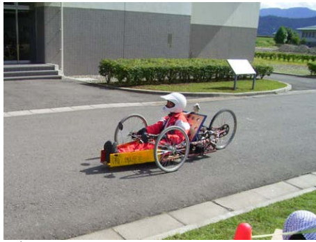
ゼッケン： 2 チーム名：清水中学校チャレンジャー 記録：114.50 km/l 表彰：チームワーク賞（実行委員長賞）