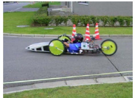
ゼッケン： 9 チーム名：Crasher（篠ノ井西中学校） 記録：87.17 km/l