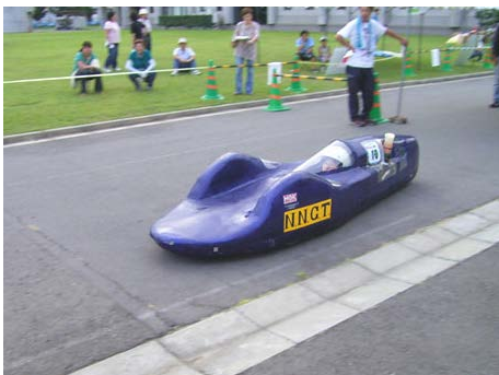
ゼッケン： 10 チーム名：長野高専エコノパワー部A 記録：リタイア 表彰：デザイン賞（SBC信越放送賞）