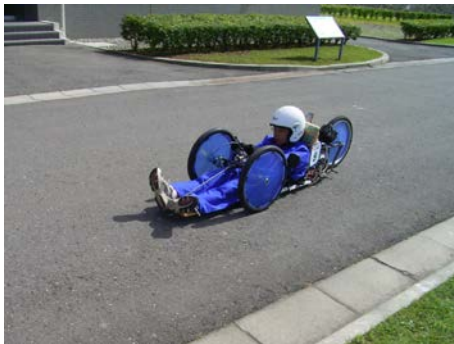
ゼッケン： 5 チーム名：Creation（篠ノ井西中学校） 記録：334.43 km/l