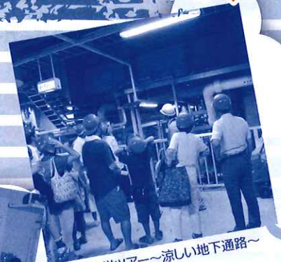
処理場見学ツアー～涼しい地下通路～