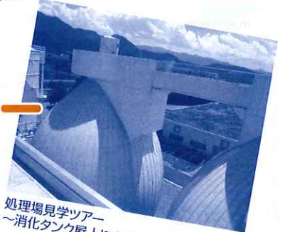
処理場見学ツアー ～消化タンク屋上に上れるよ!～